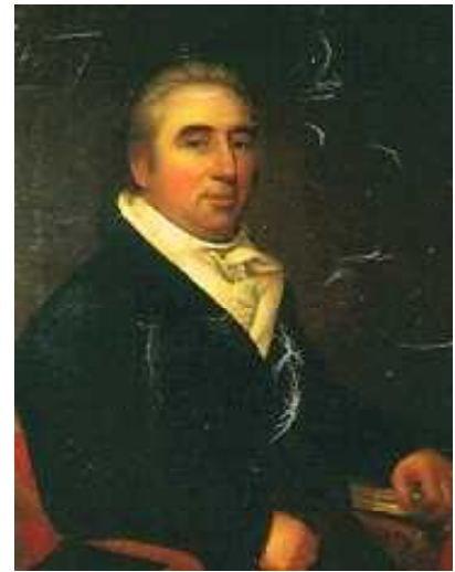
ジェームズ・マディソン