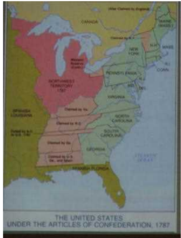
1787年当時のアメリカ合衆国

Ashby先生： これはペンシルヴェニア西部においてです。ペンシルヴェニア西部の農民に過重な税が課せられたことが原因でした。彼らはフィラデルフィアの植民地議会では少数の代表しか認められませんでした。そのた