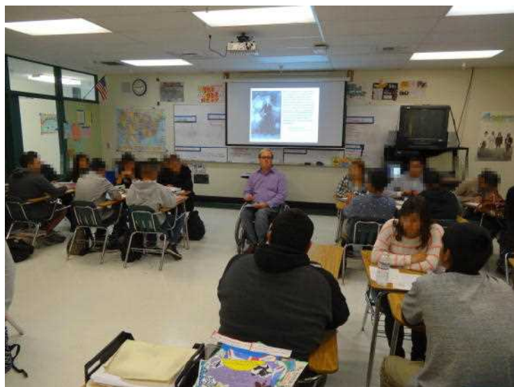
グループごとに分かれた生徒たち