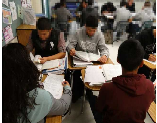
グループに分かれて熱心に議論する生徒たち